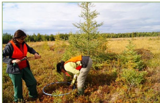
Bois-des-Bel (QC), 2010

organique et de formation de la tourbe. Malgré un couvert de sphaigne élevé et profond, le secteur restauré de Bois-des-Bel n'était pas encore un puits de carbone dix années après la restauration et l'étude suggère que cela pourrait être la conséquence d'un meilleur renouvellement du carbone souterrain par rapport aux tourbières naturelles.