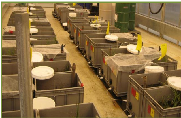
L'expérience en serre / The greenhouse experiment

Résumé : Cet article porte sur les projets de création de tourbières minérotrophes dans les sites affectés par l'exploitation des sables bitumineux en Alberta. La présente étude, menée en serre à l'Université Laval, a permis d'identifier une espèce de mousse ( Campyllum stellatum ) qui pourrait être réintroduite avec succès dans les tourbières créées. Des études sur le terrain devraient révéler si une plus grande communauté de bryophytes peut être établie dès le début de la création de fen. Après plusieurs années, il serait possible d'anticiper le développement d'un nouveau couvert de mousses (dominé par C. stellatum ) avec des plantes vasculaires telles que Carex sp. et Triglochin maritima (qui ont réussi à croître en présence d'eau contaminée provenant de l'extraction du bitume dans les sables).