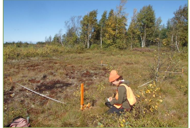
Inkerman Ferry (NB), 2012

Study sites: New Brunswick peatlands : Baie Sainte-Anne, Inkerman Ferry, Kent, Maisonneville, and Pokesudie. Quebec peatlands: Bois-des-Bel, Chemin-du-Lac, Pointe-Label, Saint-Charles-de-Bellechasse, Saint-Modeste, Verbois, and Sainte-Marguerite.