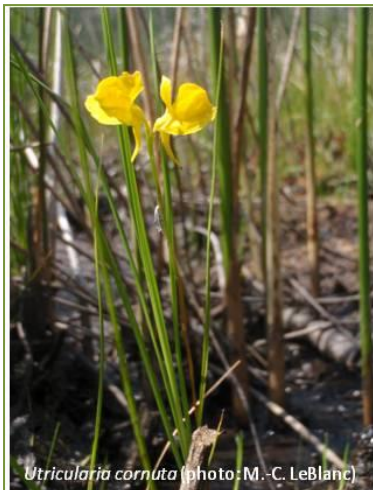
Utricularia cornuta

Résumé : Les mares sont une composante importante des tourbières, car elles contribuent à l'hétérogénéité du paysage ainsi qu'à leur diversité floristique et faunique. Cette étude, menée en serre pendant la maîtrise de Tommy Landry , avait pour but d'identifier la banque de graines et les conditions hydrologiques optimales pour la germination des plantes vasculaires typiques des bords de mare dans les tourbières. L'objectif spécifique était de déterminer l'influence de trois types de semis ainsi que deux niveaux d'eau (0 et -10 cm) sur la germination et la croissance de sept espèces de plantes vasculaires communément trouvées sur les bords de mare de tourbières. Ainsi, l'expérience menée en serre a révélé qu'un niveau d'eau près de la surface et un lit de semences composé de tourbe nue ou d'un tapis de sphaignes favorisent la germination des espèces vasculaires associées aux mares dans les tourbières. En particulier, pour les espèces de Carex , un tapis de sphaignes humides est le terreau privilégié, favorisant la